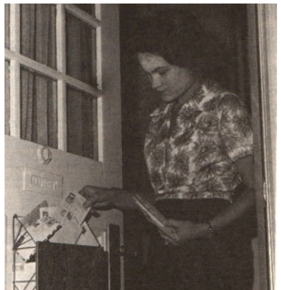
vēstuļu kastes 1962. gadā