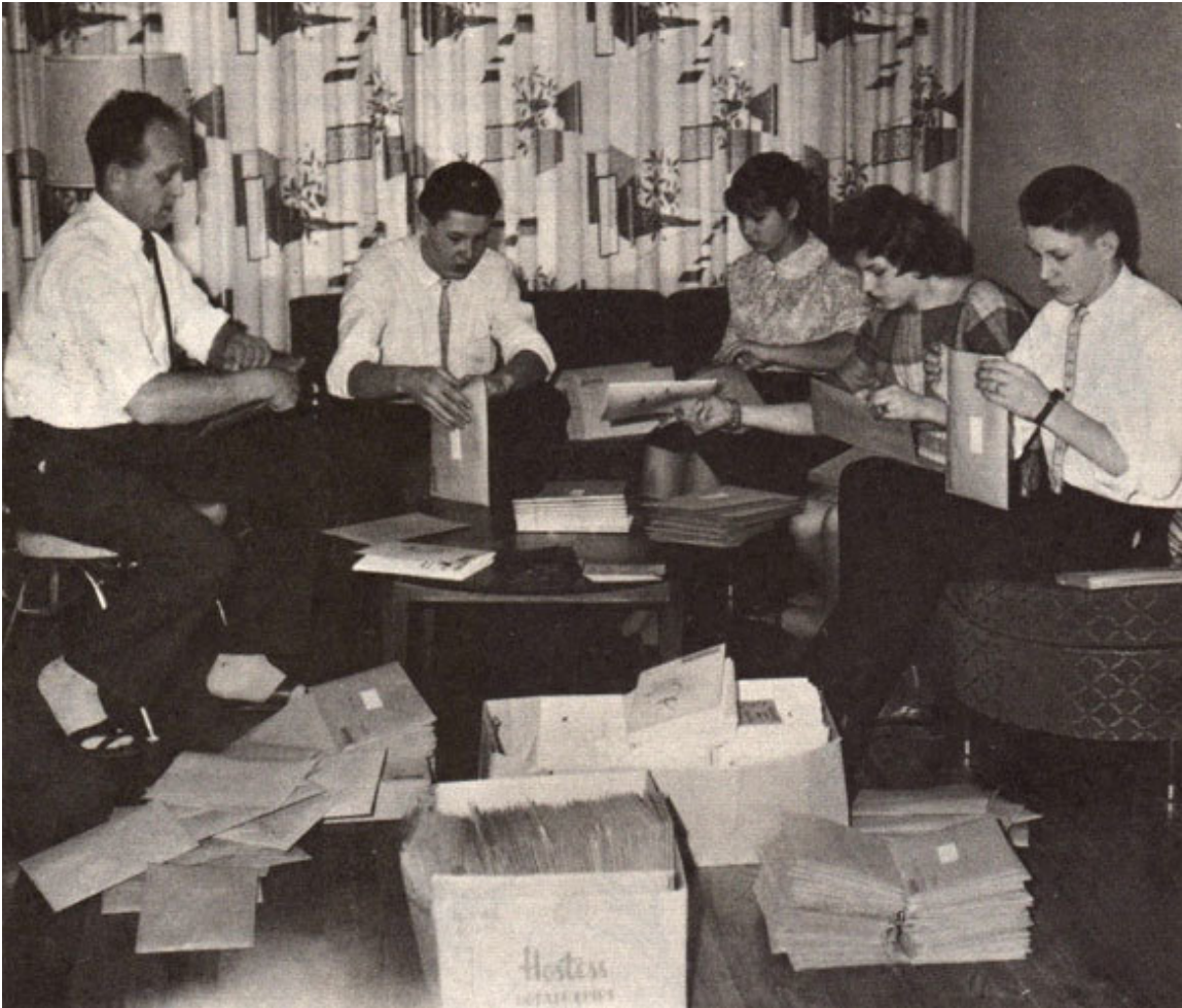
“Mazputniņa” tehniskie palīgi gatavo sūtījumus žunāla abonētājiem 1962. gadā